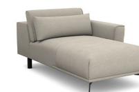
CH00R 100 cm x 78/96 cm x 175 cm 50 kg / 1 pcs