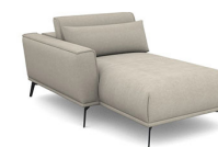
CH00L 100 cm x 78/96 cm x 175 cm 50 kg / 1 pcs