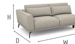
Dimensions W x H x D